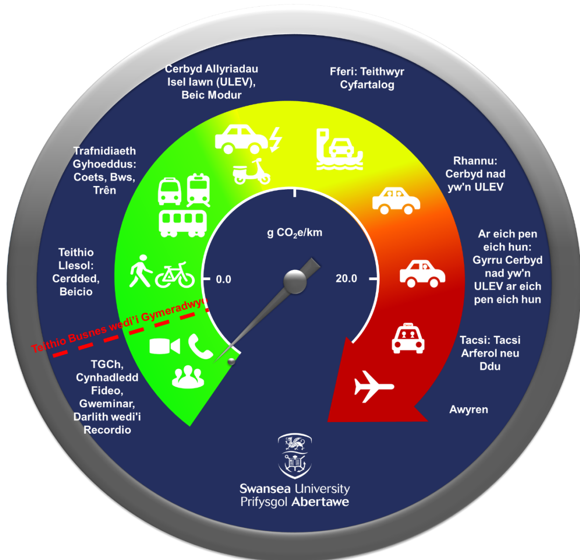
Ffigur 2: Ffigur 2: Yr Hierarchaeth Deithio